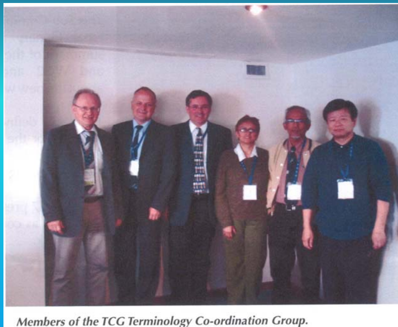
Members of the TCG Terminology Co-ordination Group.